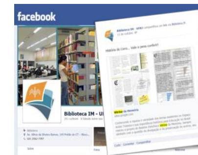
Biblioteca do Instituto de Matemática da UFRJ