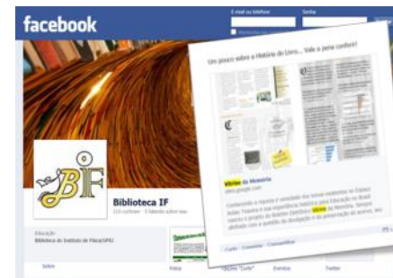
Biblioteca do Instituto de Física da UFRJ