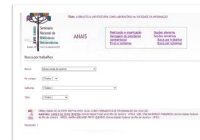
Anais do SNBU 2012