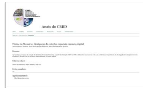
Anais do CBBB 2013