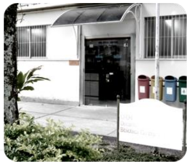
Biblioteca do CFCH/UFRJ.

“Com o crescimento da Internet e adesão cada vez maior de usuários, esta se mostrou o ambiente ideal para disseminação do trabalho desenvolvido com o acervo” (TEIXEIRA, 2012, p. 3)