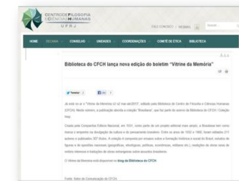
Centro de Filosofia e Ciências Humanas da UFRJ